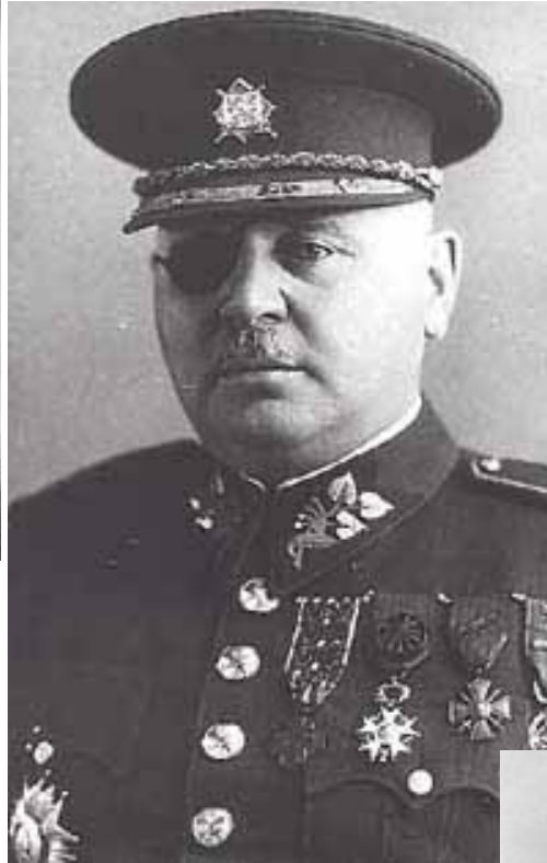
Obr. 25, J. Syrový